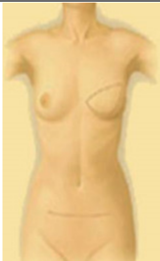
乳房重建術後外觀